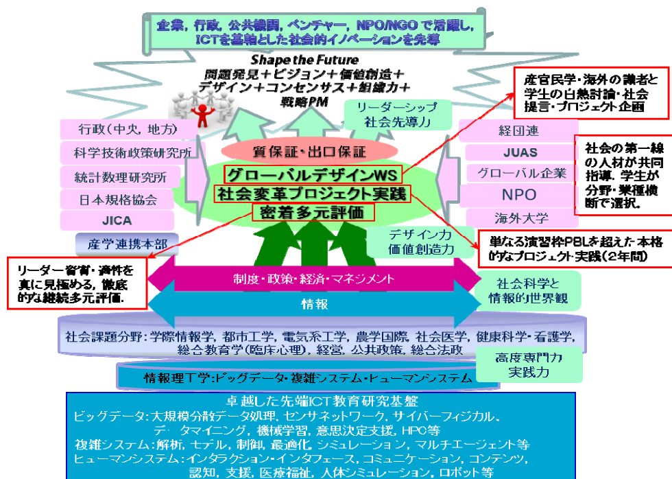
図. GCL プログラムの概念図

本プログラムでは、修士から博士後期課程までの一貫した教育課程により、ビッグデータ、複雑システム、ヒューマンシステムの先端 ICT を基軸とし、複数専門分野を統合して、社会の喫緊の課題を解決し、あるいは新たな価値をもたらす知識社会経済システムを創造的にデザインし、社会的イノベーションを先導するトップリーダーとチームを育成する。