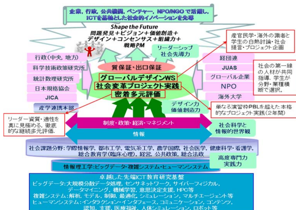
図. GCLプログラムの概念図

本プログラムでは、修士から博士後期課程までの一貫した教育課程により、ビッグデータ、複雑システム、ヒューマンシステムの先端 ICT を基軸とし、複数専門分野を統合して、社会の喫緊の課題を解決し、あるいは新たな価値をもたらす知識社会経済システムを創造的にデザインし、社会的イノベーションを先導するトップリーダーとチームを育成する。