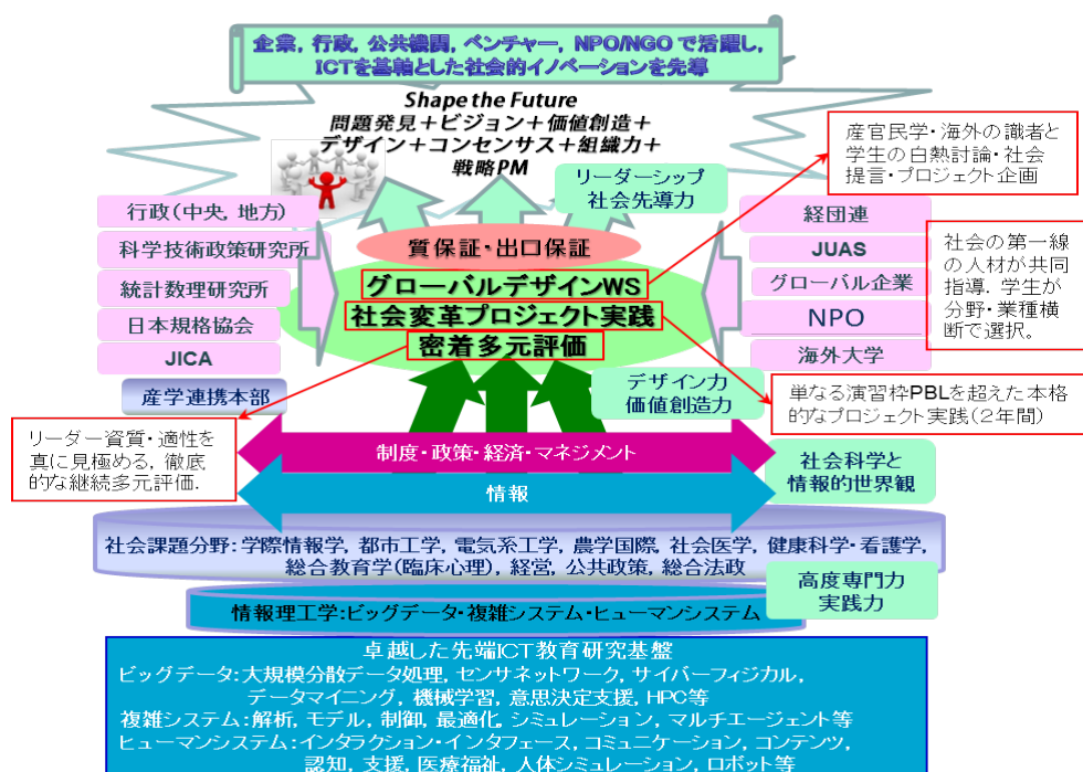
図. GCLプログラムの概念図

本プログラムでは、修士から博士後期課程までの一貫した教育課程により、ビッグデータ、複雑システム、ヒューマンシステムの先端 ICT を基軸とし、複数専門分野を統合して、社会の喫緊の課題を解決し、あるいは新たな価値をもたらす知識社会経済システムを創造的にデザインし、社会的イノベーションを先導するトップリーダーとチームを育成する。