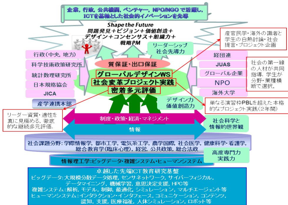
図. GCLプログラムの概念図

本プログラムでは、修士から博士後期課程までの一貫した教育課程により、ビッグデータ、複雑システム、ヒューマンシステムの先端 ICT を基軸とし、複数専門分野を統合して、社会の喫緊の課題を解決し、あるいは新たな価値をもたらす知識社会経済システムを創造的にデザインし、社会的イノベーションを先導するトップリーダーとチームを育成する。