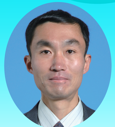
東京大学生産技術研究所 教授 ソーシャルICT研究センター 特任教授