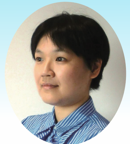
東京大学大学院情報理工学系研究科 ソーシャルICT研究センター 特任准教授